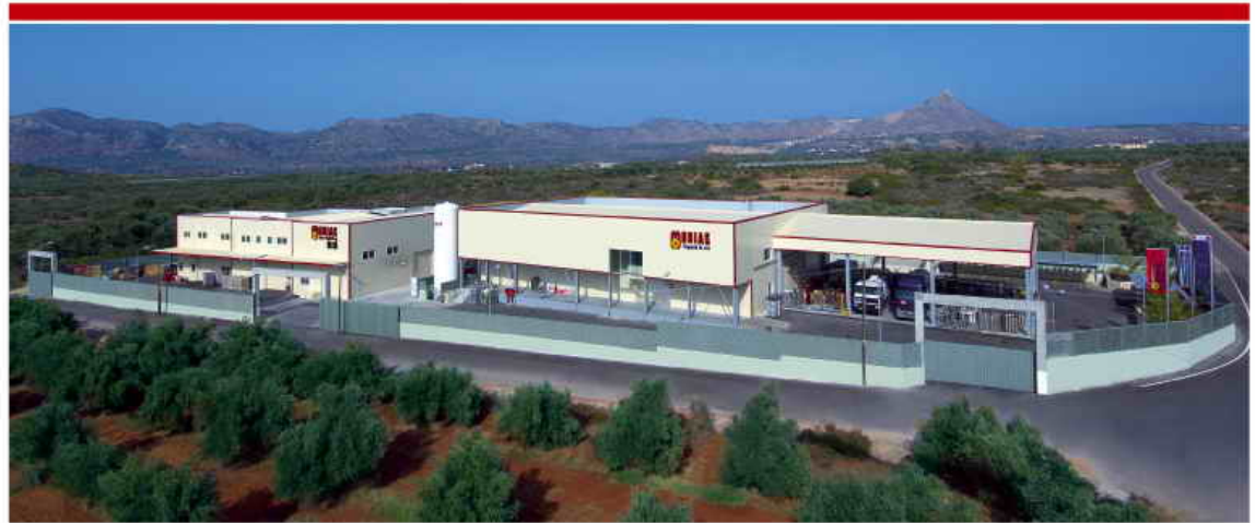
Εγκαταστάσεις Χανιά - Κρήτης (περιοχή: Καθιανά Ακρωτηρίου)

Το 2003 η ΜΟΒΙΑΚ ΑΕ προβαίνει σε μία στρατηγικής σημασίας επένδυση, η οποία την εκτοξεύει στη Πρώτη Θέση της Βαλκανικής Αγοράς στον ευαίσθητο τομέα των Πυροσβεστικών Ειδών. Το νέο εργοστάσιο στα Χανιά Κρήτης περιλαμβάνει μία από τις 5 μεγαλύτερες Αυτόματες Μονάδες Συναρμολόγησης Πυροσβεστήρων στην Ευρώπη και είναι εφοδιασμένο με όλο τον απαιτούμενο εξοπλισμό προκειμένου να καθιερώσει υψηλές Προδιαγραφές στις Προσφερόμενες Υπηρεσίες και Προϊόντα, αποβλέποντας στη Διασφάλιση του τελικού χρήστη. Κρυσταλλικές Δεξαμενές Αποθήκευσης Υγροποιημένων Αερίων και Μηχανήματα Υδραυλικής Δοκιμής και Πλήρωσης Φιαλών Υψηλής Πίεσης συμβάλλουν στη περεταίρω Ανάπτυξη και Αναβάθμιση του Τομέα Αερίων, αποφέροντας ιδιαίτερα σημαντικές συνε-