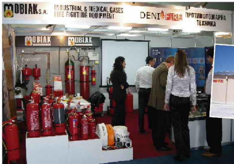
Συμμετοχή της MOBIAK A.E. σε Έκθεση στην Βουλγαρία – Σεπτέμβριος 2008.

Τα τελευταία χρόνια η εταιρία μας έχει εισέλθει δυναμικά στην Βουλγάρικη αγορά μέσω αντιπροσώπου που προωθεί αποκλειστικά τα προϊόντα της MOBIAK A.E. Μια επιτυχημένη συνεργασία με μια από τις μεγαλύτερες και γρηγορότερα αναπτυσσόμενες εταιρίες που δραστηριοποιούνται στην Βουλγαρία η οποία ξεκίνησε το 2005 και με μέσο ετήσιο ποσοστιαίο ρυθμό μεταβολής πωλήσεων πάνω από 60%, συνεχίζεται έως και σήμερα. Η πιστοποιημένη ποιότητα, το μεγάλο απόθεμα, η ποικιλία των προϊόντων και οι ανταγωνιστικές τιμές αποτελούν τους σημαντικότερους παράγοντες ανάπτυξης της MOBIAK A.E. ως έναν από τους πρωτοπόρους της Βαλκανικής Χερσονήσου στον τομέα της παραγωγής και εμπορίας πυροσβεστικών ειδών.