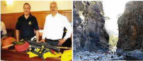
Γράφει ο Απόστολος Διαμαντόπουλος

Το Φαράγγι της Σαμαριάς βρίσκεται στην Κρήτη, στο νομό Χανίων. Με μήκος 18 χιλιόμετρα είναι το μεγαλύτερο σε μήκος φαράγγι της Ευρώπης. Είναι Εθνικός Δρυμός της Ελλάδας από το 1962 και φιλοξενεί πολλά ενδημικά είδη πουλιών και ζώων, το πιο γνωστό από τα οποία είναι ο κρητικός αίγαγρος γνωστός και σαν κρι κρι. Το όνομά του το πήρε από το εγκαταλελειμμένο