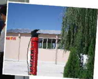
Εγκαταστάσεις Αντιπροσώπου MOBIAK A.E. στην Βουλγαρία.