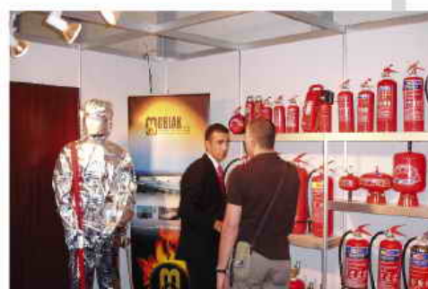
Φωτογραφικό υλικό από την από κοινού συμμετοχή της MOBIAK A.E και του αντιπροσώπου της στην Κύπρο UNIFIRE EXTINGUISHERS Ltd. στην Διεθνή Έκθεση της Κύπρου στα τέλη Μαΐου 2009 η οποία στέφθηκε με απόλυτη επιτυχία.