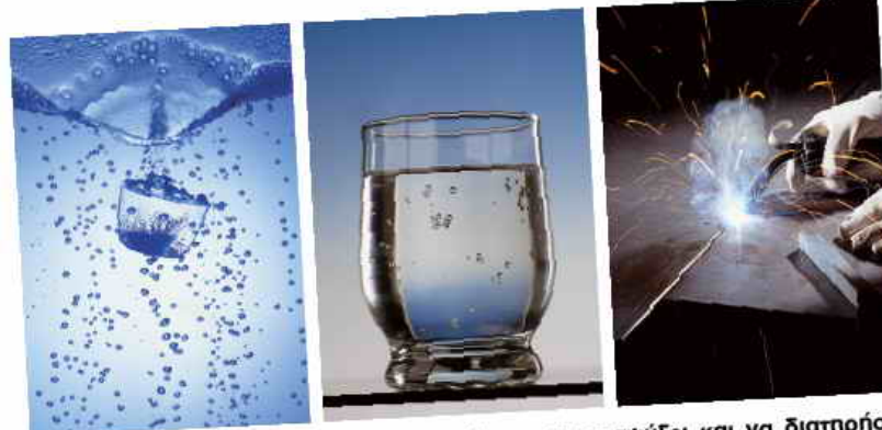
Το άζωτο χρησιμοποιείται για να κρυώσει, να καταψύξει και να διατηρήσει αποθηκευμένα προϊόντα... Το καθαρό διοξείδιο του άνθρακα χρησιμοποιείται στην ποτοποιία ανθρακούχων υγρών... Το Οξυγόνο χρησιμοποιείται στην Συγκόλληση, κοπή και επικάλυψη...

Φαρμακευτική: χρησιμοποιείται για αδρανοποίηση, χημικές συνθέσεις, όξυνση