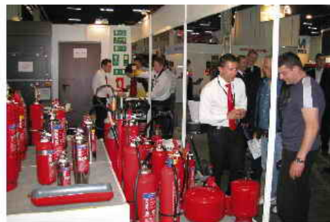
Έκλειψαν τις εντυπώσεις ο «έξυπνος Πυροσβεστήρας Λουλούδι» και οι πυροσβεστήρες οροφής!