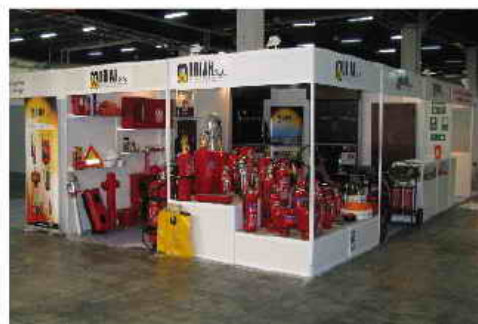
Γενική άποψη του περιπτέρου της MOBIAK A.E. στην έκθεση της Πολωνίας – Ιούνιος 2009.

Στο Kielce της Πολωνίας βρέθηκε τον Ιούνιο - 2009 αποστολή της MOBIAK A.E. όπου και συμμετείχε δυναμικά με δικό της περίπτερο στην μεγαλύτερη έκθεση (EDURA -2009) για πυροσβεστικό εξοπλισμό της χώρας. Δόθηκε ιδιαίτερη έμφαση στους πυροσβεστήρες οροφής στους φορητούς 6 και 9 λίτρων F-CLASS (wet chemical) όπως επίσης και στα μόνιμα συστήματα F-CLASS και CO2. Ιδιαίτερη εντύπωση προξένησε το νέο - καινοτομικό προϊόν της MOBIAK «Έξυπνος Πυροσβεστήρας Λουλούδι» για το οποίο πολλοί από τους επισκέπτες ενθουσιάστηκαν από την καινοτομική λειτουργία και χρησιμότητά του.