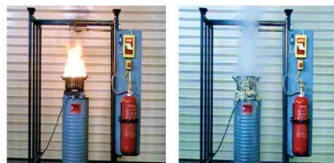
Πρότυπο Σύστημα (A) εν δράσει.

Η μελέτη και η εγκατάσταση γρήγορα γίνεται με ευθύνη