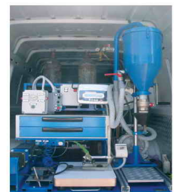
Κινητή μονάδα Επανελέγχου – Αναγόμωσης