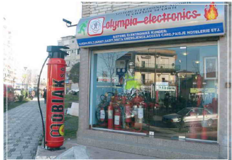
Κατάστημα λιανικής σε κεντρικό σημείο των Τιράνων.