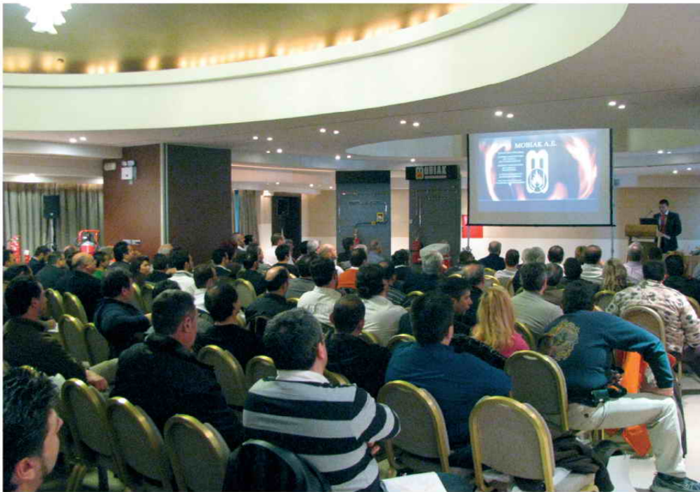
Από ημερίδα στην Αθήνα