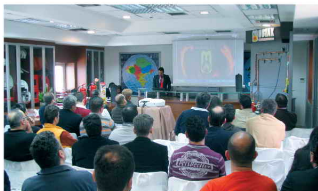
Από ημερίδα στα Χανιά