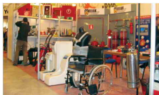
Πυροσβεστικός και Ιατρικός Εξοπλισμός σε έκθεση στην Αλβανία.