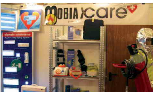
Συμμετοχή MOBIAK και MOBIAKCARE σε έκθεση στα Τίρανα σε συνεργασία με τον Αντιπρόσωπο Αλβανίας.