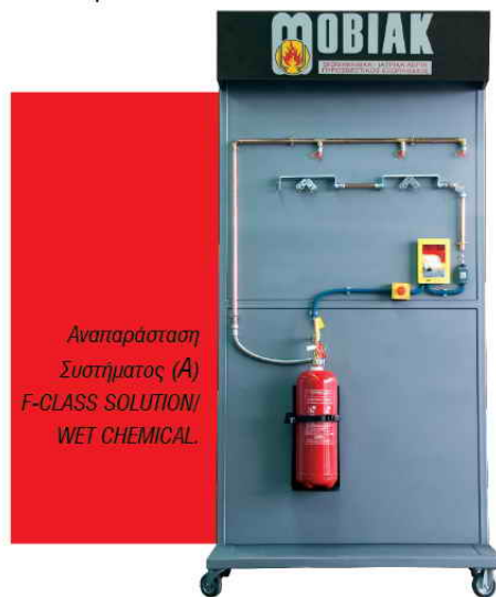
Αναπαράσταση Συστήματος (Α) F-CLASS SOLUTION/ WET CHEMICAL.

ΣΥΣΤΗΜΑ (Β) ΚΑΤΑΣΒΕΣΗΣ F-CLASS SOLUTION / WET CHEMICAL