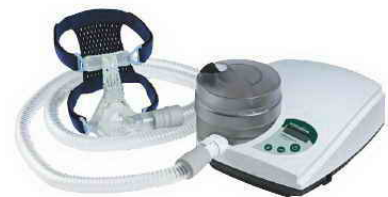
Auto-CPAP SOMNObalance • της WEINMANN

Η Άπνοια στον ύπνο είναι ιάσιμη ασθένεια αρκεί ο πάσχων να ακολουθήσει πιστά τις οδηγίες του ιατρού, να κάνει καθημερινή χρήση της θεραπευτικής συσκευής και να απολέσει το περιττό βάρος.