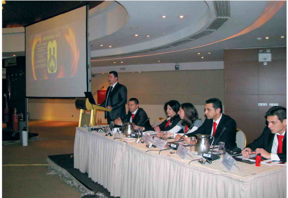
Από ημερίδα στην Αθήνα

Η εταιρία MOBIAK A.E. παρακολουθώντας τις ραγδαίες εξελίξεις σχετικά με τα Μόνιμα Συστήματα Τοπικής Εφαρμογής Κατάσβεσης Μαγειρείων προχώρησε σε αυστηρά οικογενειακό κλίμα, μεταξύ των συνεργατών της, στη διοργάνωση Ημερίδων Ενημερωτικού-Εκπαιδευτικού χαρακτήρα αναφορικά με τα Μόνιμα Συστήματα Τοπικής Εφαρμογής F-Class Solution/Wet Chemical.