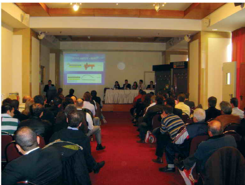
Από ημερίδα στη Θεσσαλονίκη

νίκη στις 20 & 21 Φεβρουαρίου 2010, με συμμετοχή άνω των 130 αναγνωρισμένων εταιριών που μαζί με τα αρμόδια άτομα, τους μηχανολόγους και τους εγκαταστάτες τους, μας δόθηκε η δυνατότητα να συζητήσουμε, να ανταλλάξουμε απόψεις, να εκφράσουμε προβληματισμούς και να απαντήσουμε στα ερωτήματα τα οποία μας τέθηκαν. Στο διήμερο αυτό παραβρέθηκαν και οι αντιπρόσωποι μας από τις χώρες της βαλκανικής χερσονήσου. Τη σκυτάλη πήρε η Αθήνα όπου στις 27 & 28 Φεβρουαρίου, με συμμετοχή άνω των 235 αναγνωρισμένων εταιριών από την