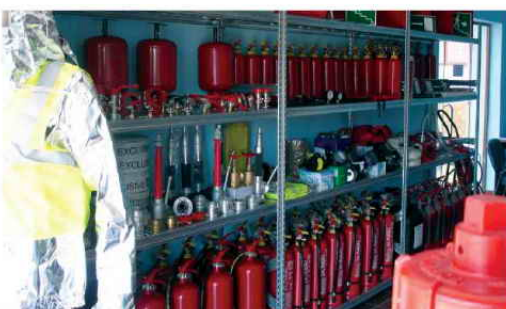
Κατάστημα Λιανικής στα Τίρανα