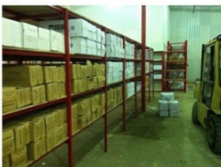
Φωτό: Εσωτερική δομή του Νέου Κέντρου Διανομής