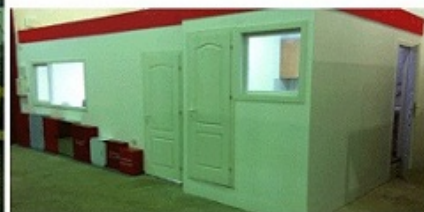
Φωτό: Γραφείο Διεύθυνσης & Τιμολόγησης του Κέντρου Διανομής