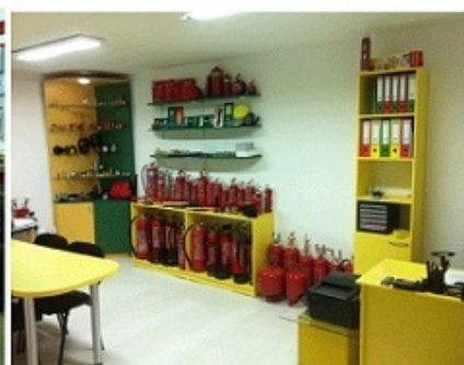
Φωτό: Εσωτερική όψη του Γραφείου Διεύθυνσης & Τιμολόγησης.