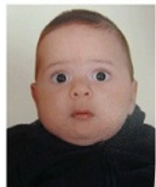
Ο Γ. Σβουράκης Μεγαλίνει...