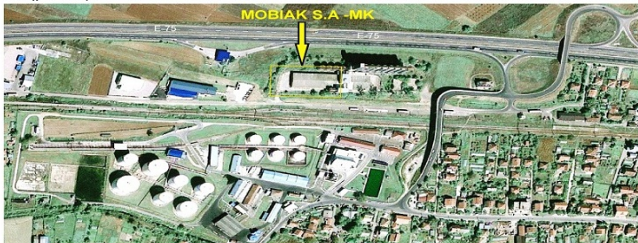
Φωτό: Εικόνα Δορυφόρου - Πανοραμική Όψη του Νέου Κέντρου Διανομής