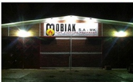
Φωτό: Πρόσοψη του Νέου Κέντρου Διανομής

Στο φωτογραφικό υλικό το οποίο ακολουθεί μπορείτε να δείτε ένα μικρό μέρος από το Νέο Κέντρο Διανομής της MOBIAK στα Σκόπια το οποίο είναι σχεδόν 2.000μ 2 .