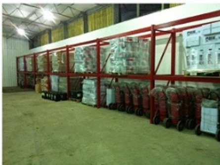
Φωτό: Ομοίωμορφη-Εργονομική Κατανομή των Προϊόντων