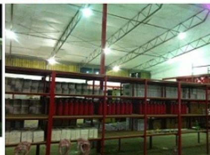
Φωτό: Άλλη όψη του εσωτερικού χώρου του Κέντρου Διανομής.