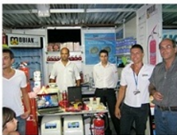
Μέλη από την Ομάδα της MOBIAK

Η MOBIAK συμμετείχε στο 1 ο Φεστιβάλ «Τουρισμός Γη & Πολιτισμός», το οποίο διοργανώθηκε φέτος από το Δήμο Πλατανιά υπό την αιγίδα της Περιφέρειας Κρήτης – Περιφερειακής Ενότητας Χανίων. Η Έκθεση έλαβε χώρα από την Παρασκευή 26 Αυγούστου μέχρι και την Τετάρτη 31 Αυγούστου 2011, μεταξύ 18:30-23:30 στο Γεράνι του Δήμου Πλατανιά, σε χώρο παραπλεύρως των ξενοδοχείων Caldera Creta Paradise και Caldera Beach.